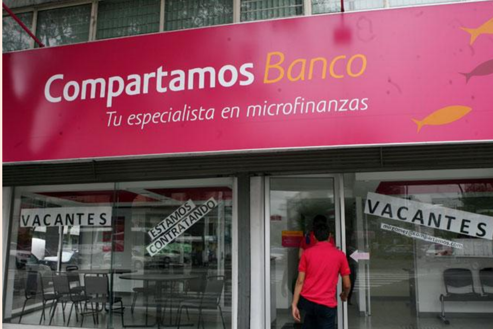
Compartamos Banco tiene la certificación.