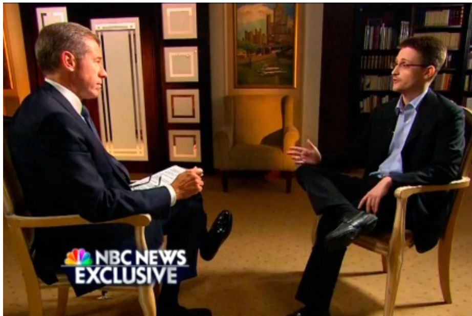
Snowden, en entrevista con Brian Williams para la NBC.

“Declarar la inconstitucionalidad de esta normativa es un gran avance, sobre todo porque esta norma se dio en el 2006 y luego de las revelaciones de Snowden fueron adelante (con su cancelación)”, afirmó Rodríguez.