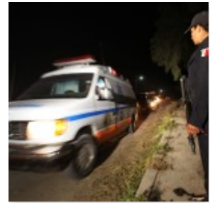
Hospitalizan a seis por contaminación de cobalto 60