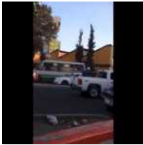
Presunto secuestro en Metro Oceanía era una detención policial: PGJDF